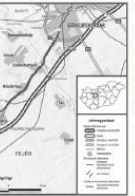
Budapest-Balaton kerékpárút nyomvonalai Széchenyivárosi/Budapest