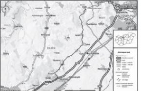
Budapest-Balaton kerékpárút nyomvonalai Széchenyivárosi/Budapest

Az önkormányzat a megújuló kerékpárhálózat fejlesztését a 2022. évi költségvetésében a megújuló kerékpárhálózat fejlesztésére fordítja. A projekt keretében a megye területén új kerékpárutakat építenek meg, amelyek összeköthetik a városokat és a falvakat. A hálózathoz tartoznak a városok közötti útszakaszok, a falvak közötti útszakaszok, valamint a városok és a falvak közötti útszakaszok.